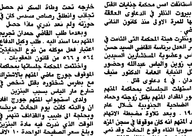
استأنفت أمس محكمة جنائيات القتل في بيروت النظر في الدعاوى العالقة لديها للمرة الاولى منذ كانون الثاني الماضي